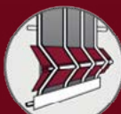
Profilés de plis PVC