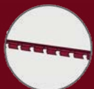
Supports de lames Clovision