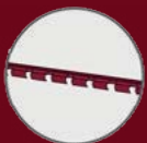
Supports de lames Clovision