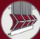
Profilés de plis aluminium