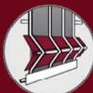
Profilés de plis PVC