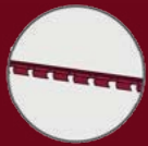
Supports de lames Clovision